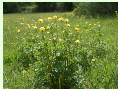
Europäische Trollblume Trollius europaeus