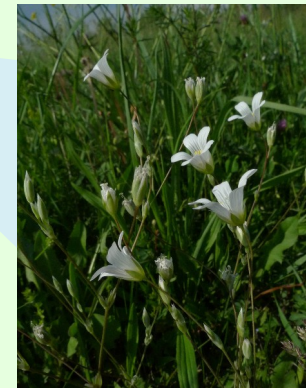
Fünzfählige Weißmiere Moenchia mantica