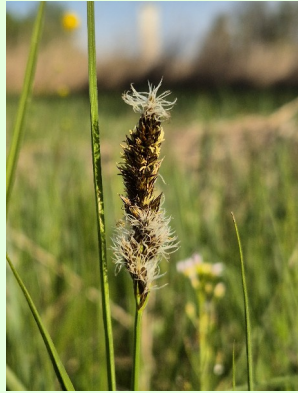
Kamm-Segge Carex disticha