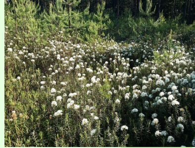
Sumpf-Porst Rhododendron tomentosum