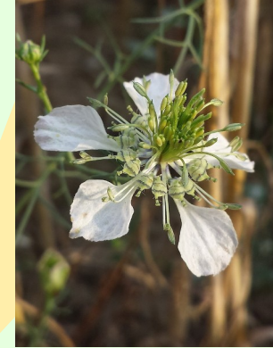
Acker-Schwarzkümmel Nigella arvensis